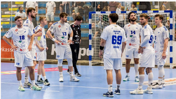
Ratlose Gesichter beim DRHV nach der deutlichen Niederlage beim TSV Bayer Dormagen.